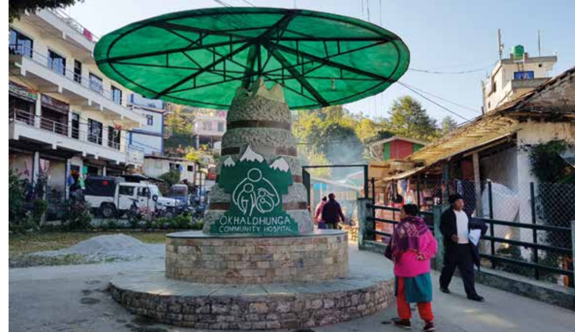
Et bilde fra inngangspartiet til Okhaldhunga Community Hospital.

De fleste i Nepal har bakgrunn i hinduisme eller buddhisme. I begge religionene er