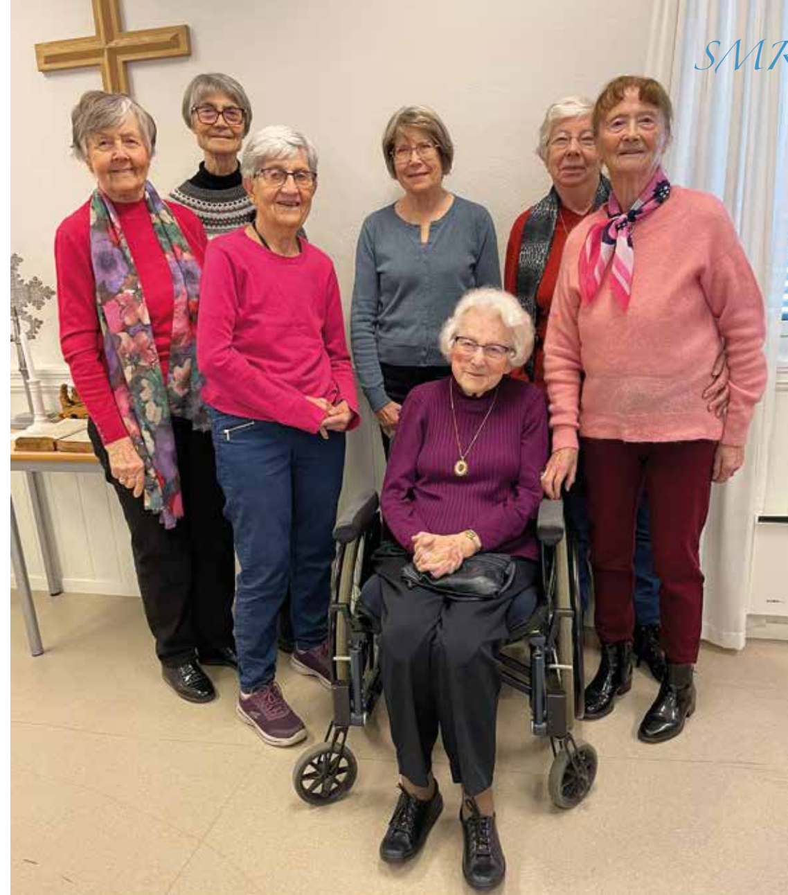
En liten hilsen fra SMR-gruppen i Sandefjord.

I Nepal og mange andre land i verden er psykisk sykdom fortsatt veldig tabubelagt. Matrika er veldig klar på at det er Gud som har gitt ham dette arbeidet og at han er en kanal for Jesus i alt han gjør. Han har erfart smerten ved å være mentalt syk, men i dag besøker han regjeringskontorene med verdighet. Og han blir tatt på alvor! forteller Astrid og Grethe til Misjonsringen.