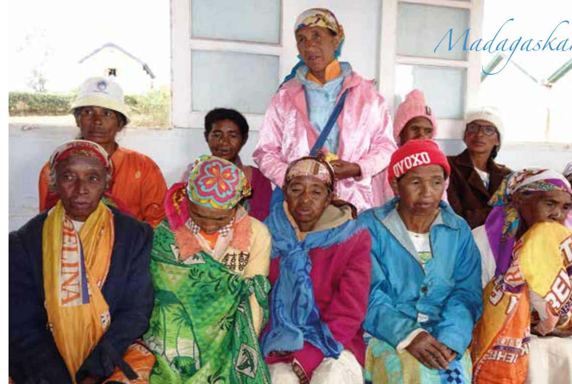
Selv om de tradisjonelle fødselshjelperne ikke har jordmorutdannelse, er deres råd og hjelp viktig for mange gravide kvinner på Madagaskar.

Madagaskar har cirka 30 millioner innbyggere. Spedbarnsdødeligheten er 38,3 promille. I Norge var den i 2020 til sammenligning på 1,7 promille. (Kilde: SNL)