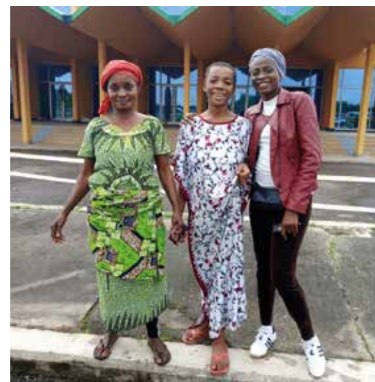
Jentene lærer seg et yrke mens de er på sykehuset.

Og det gjør vi gjerne! Det er en ære for oss å fly dem. Takket være støtte, slik SMR har gitt oss, har vi mulighet for å bidra.