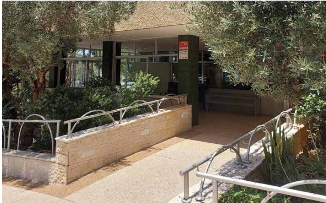
Kjent inngangsparti: Gjennom årene har flere medlemmer i SMR vært og besøkt Ebenezerhjemmet.