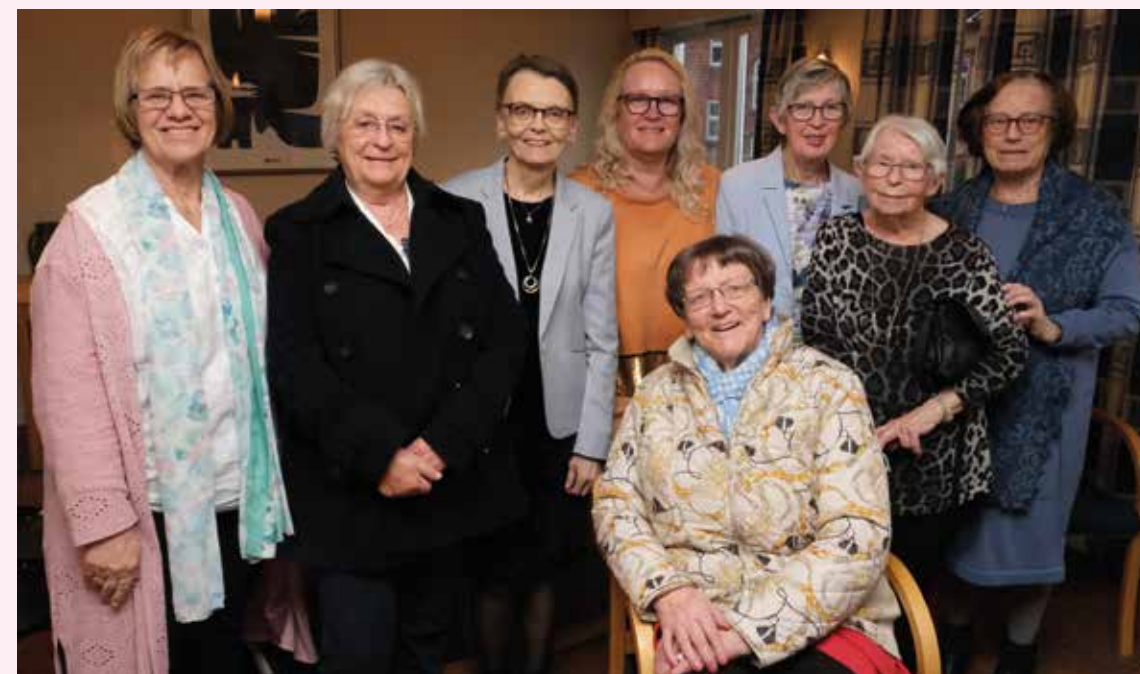
Medlemmer fra Moss SMR og Fredrikstad SMR tok turen til Mysen for å gratulere den flotte jublanten.