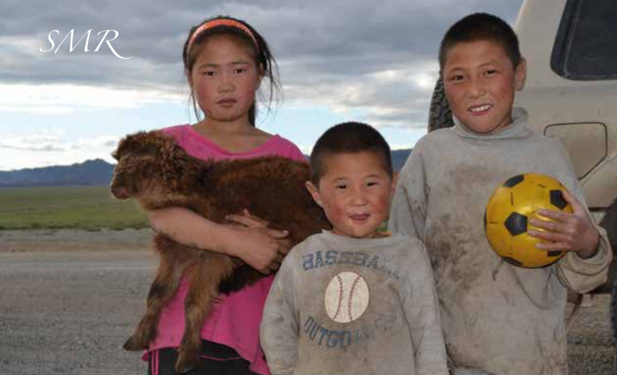
HimalPartner har hatt ulike prosjekter i de tibetanske områdene i Kina siden midten av 90-tallet.