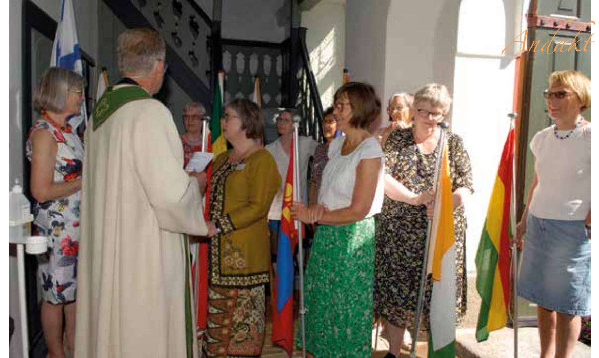
Som avslutning på landsmøtet i 2022 deltok SMR under gudstjenesten i Fredriksvern kirke i Stavern.