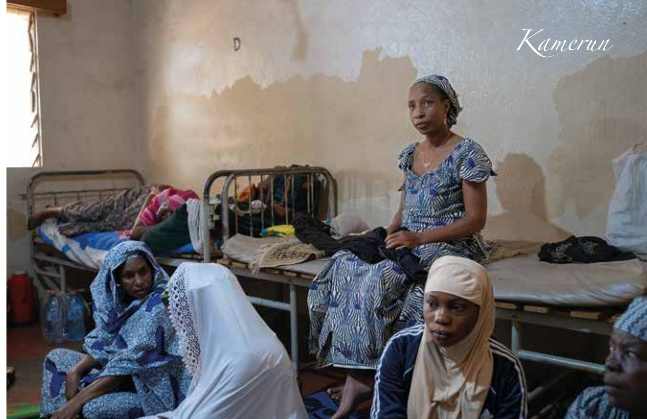
– Sykehuset er veldig slitt. Det trenger å bli pusset opp, forteller Bergseth.

– Mødredødeligheten i Kamerun er anslått til 280 pr 100.000 levendefødte barn. I Norge er den 1-2. Ved sykehuset i Ngaoundéré er fødeavdelingen slitt. Takket være en gave fra en dame, greier man nå å pusse opp noen rom og utbedre noen dusjer og toaletter. Det er innenfor mor og barn vi har begynt arbeidet med å bedre kompetansen med en