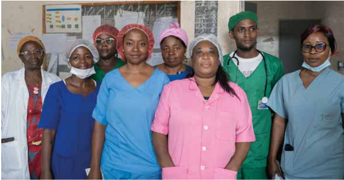
Her ser vi staben på fødeavdelingen med jordmor helt fremst.