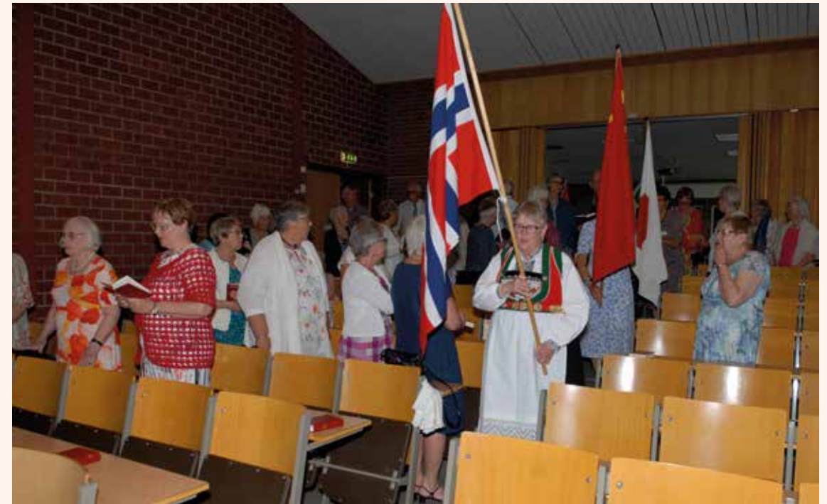
Flaggparaden som viser de ulike misjonslandene er fast tradisjon på hvert landsmøte i SMR.