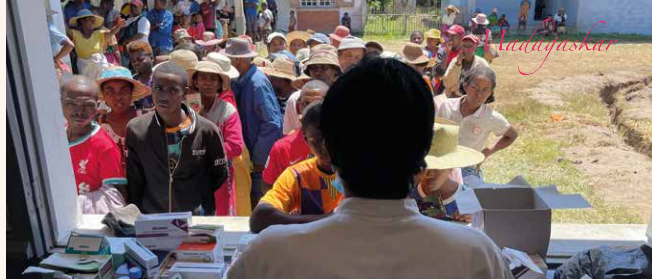
For mange er dette det eneste helsetilbudet de får i løpet av året.

– dette er ikke forpliktende, men vi vil ha en pekepinn på hvor mange som tenker å være med slik at vi kan bestille transport. Pris vil avhenge av dette.