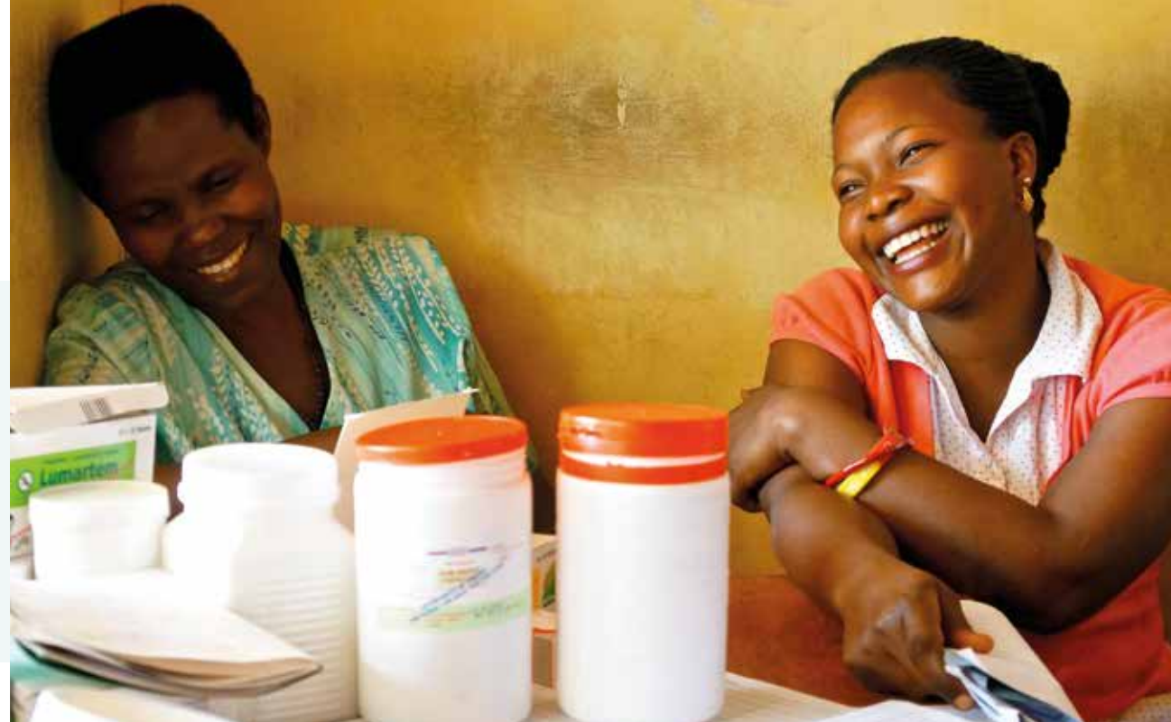
Sykepleiernes Misjonsring støtter mange ulike helseprosjekter hvert år. (Illustrasjonsfoto)

særlig kontakten med gruppene. Kun én gruppe er nedlagt i løpet av året, og skrev i den forbindelse et helt nydelig (håndskrevet!) brev med mange vyer fra en mangeårig tilknytning til SMR fellesskapet. Brevet tas vare på, og vil bli sendt til misjonsarkivet i Stavanger, fordi det så fint tegner linjer i SMRs historie.