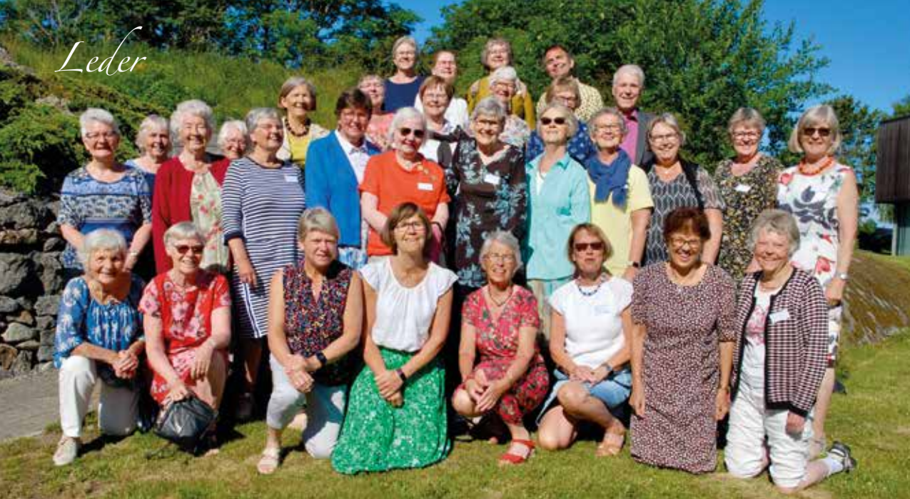
En glad gjeng samlet til landsmøte i Stavern for tre år siden. I juni får vi muligheten til å treffes igjen.