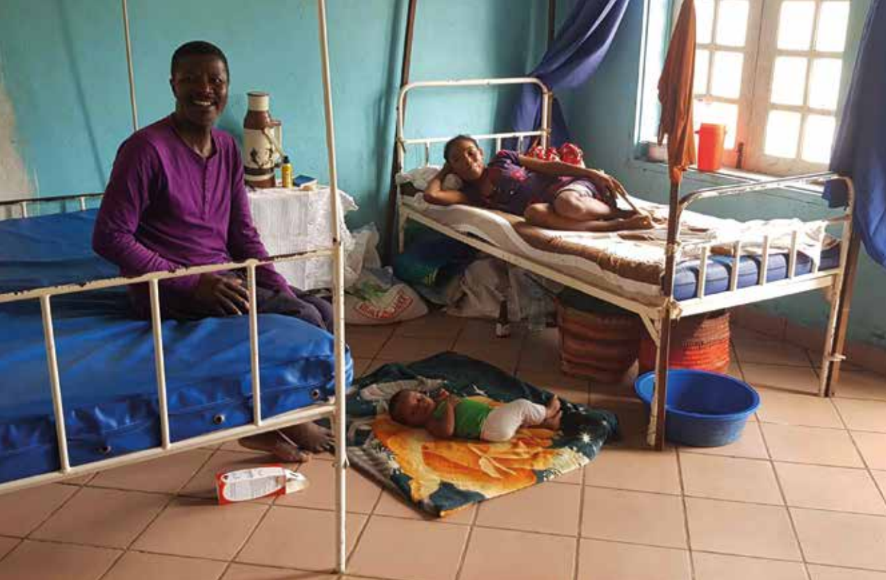
Fistelproblemet finnes ikke bare i Etiopia. Også på Madagaskar lider mange kvinner av denne skaden. Her er bilde av et pasientrom på Betela sykehus hvor hele familien er sammen.