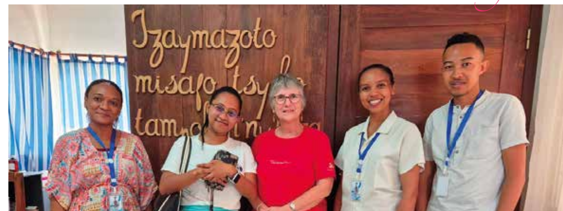
På veggen ser du sykehusets motto. Oversatt til norsk blir det «Vi som flittig går til svangerskapskontroll opplever ingen ubehagelige overraskelser.»

Heldigvis finnes det hjelp. På Betela sykehus ledes arbeidet av dr. Hery