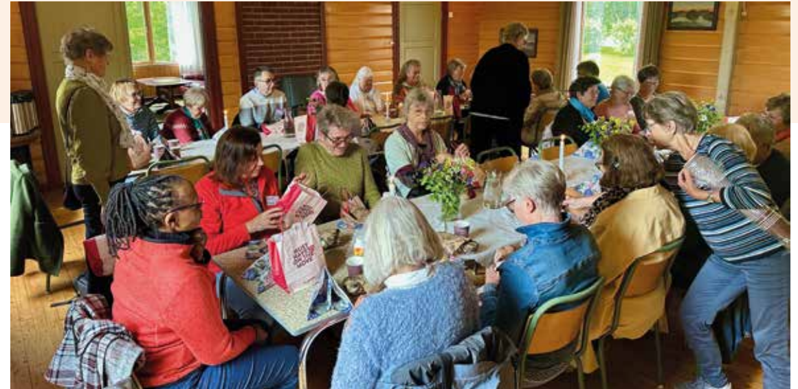
På landsmøtet ble det arrangert en spennende utflukt til Tautra. Her har vi lunsj-stopp underveis.

Oslos SMR gruppe ble avsluttet i 2025. Men resten av de 26 gruppene «holder