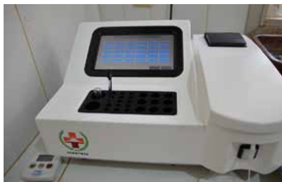
Bedre diagnostikk gir tryggere behandling.

– Dette er ledelsen ved sykehuset veldig glad for. Det er ikke bare pengene, men at vi bryr oss om dem. De er opptatt av å gi best mulig behandling og pleie til alle som kommer til sykehuset, men pengene strekker ikke med til vedlikehold og bedre utstyr