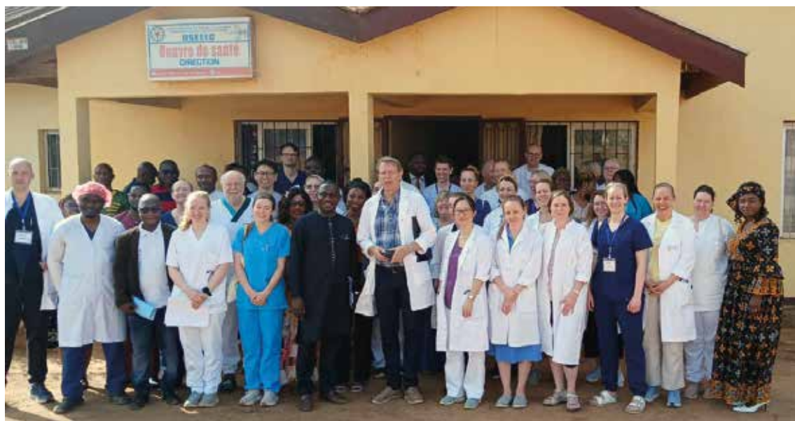
Norske og kamerunske leger samlet under kurs i trope- og infeksjonsmedisin ved sykehuset.