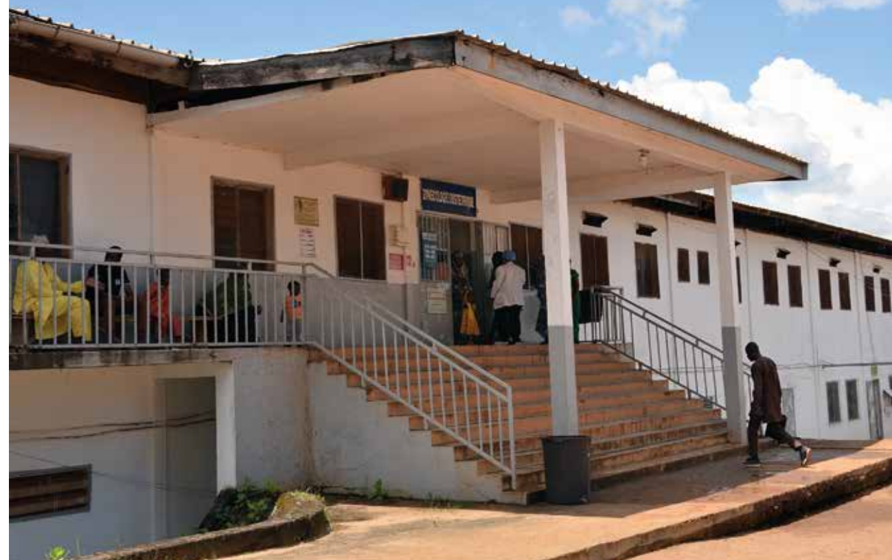
Inngangen til sykehuset i Ngaoundéré. For mange er dette døren inn til håp, behandling og omsorg.