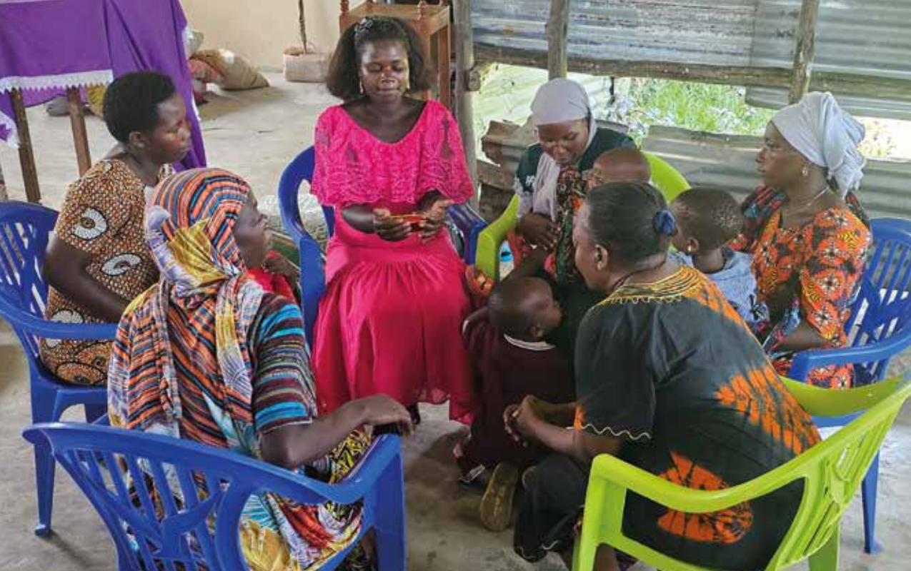
Kvinner samlet i sirkel lytter sammen til en radiosending fra Hagars reise.