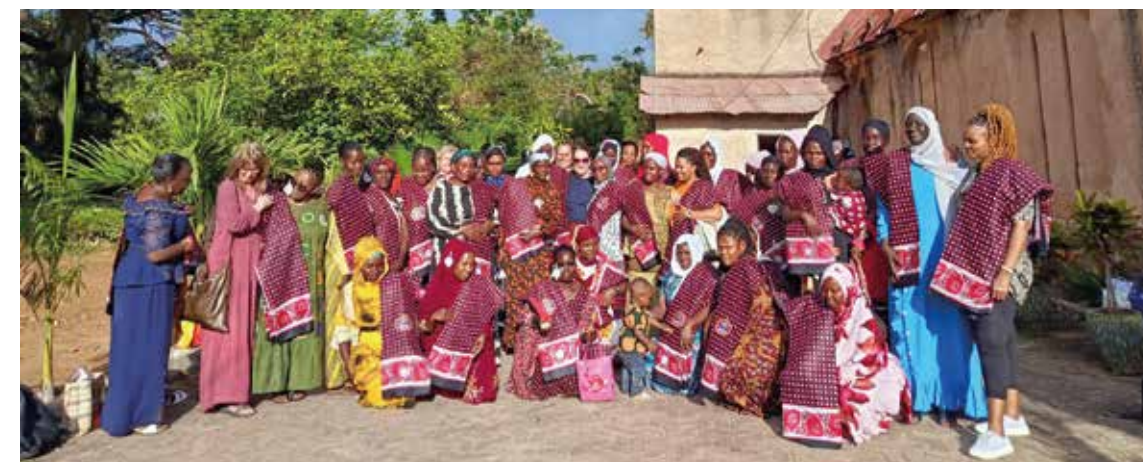
I løpet av det siste året har rundt 70 kvinner deltatt på undervisning, og mange av dem bruker nå det de har lært til å støtte andre i sine lokalsamfunn. Prosjektet gir både håp og konkrete verktøy i hverdagen.

Støtten har bidratt til undervisning og oppfølging av kvinner på Zanzibar som lever med erfaringer av vold, tap og dype traumer. Gjennom seminarer om traumehåndtering, mestring og heling har deltakerne fått både kunnskap og åndelig støtte. Undervisningen tar på alvor hvordan smerte setter spor i