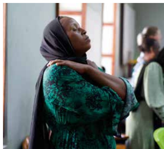
En enkel øvelse for ro og regulering – små grep som kan gi støtte og hjelp i hverdagen.

Gjennom prosjektet «Hagars reise» får kvinner på Zanzibar undervisning, fellesskap og støtte til å bearbeide traumer og finne nytt håp. Med støtte fra Sykepleiernes Misjonsring bidrar prosjektet til heling – båret av tro, kunnskap og bønn.